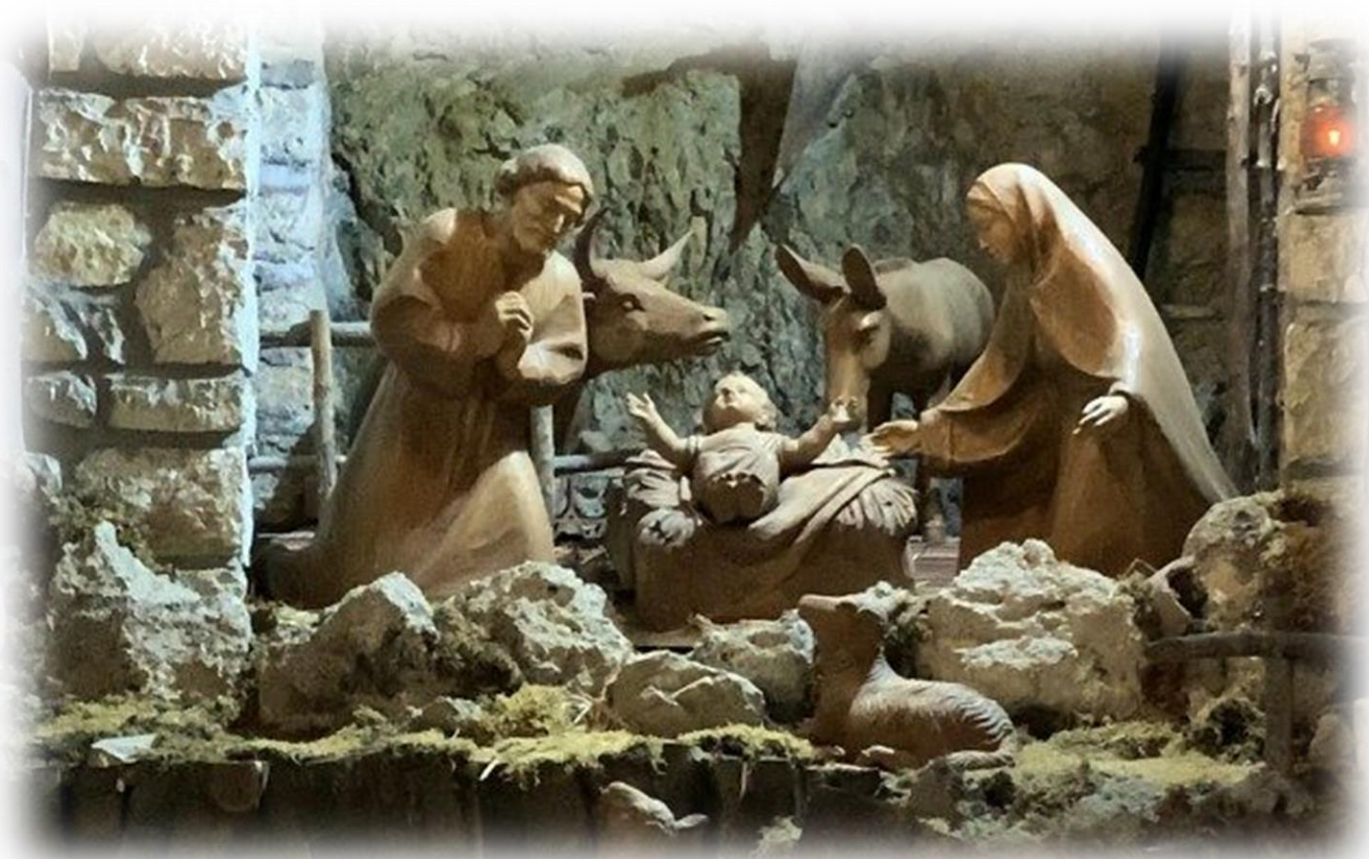
A nativity scene in the Hermitage of Greccio Sanctuary

May Christ, born of Mary and now present in the Eucharist throughout the world, be your source of strength, your hope during trials and your constant joy!